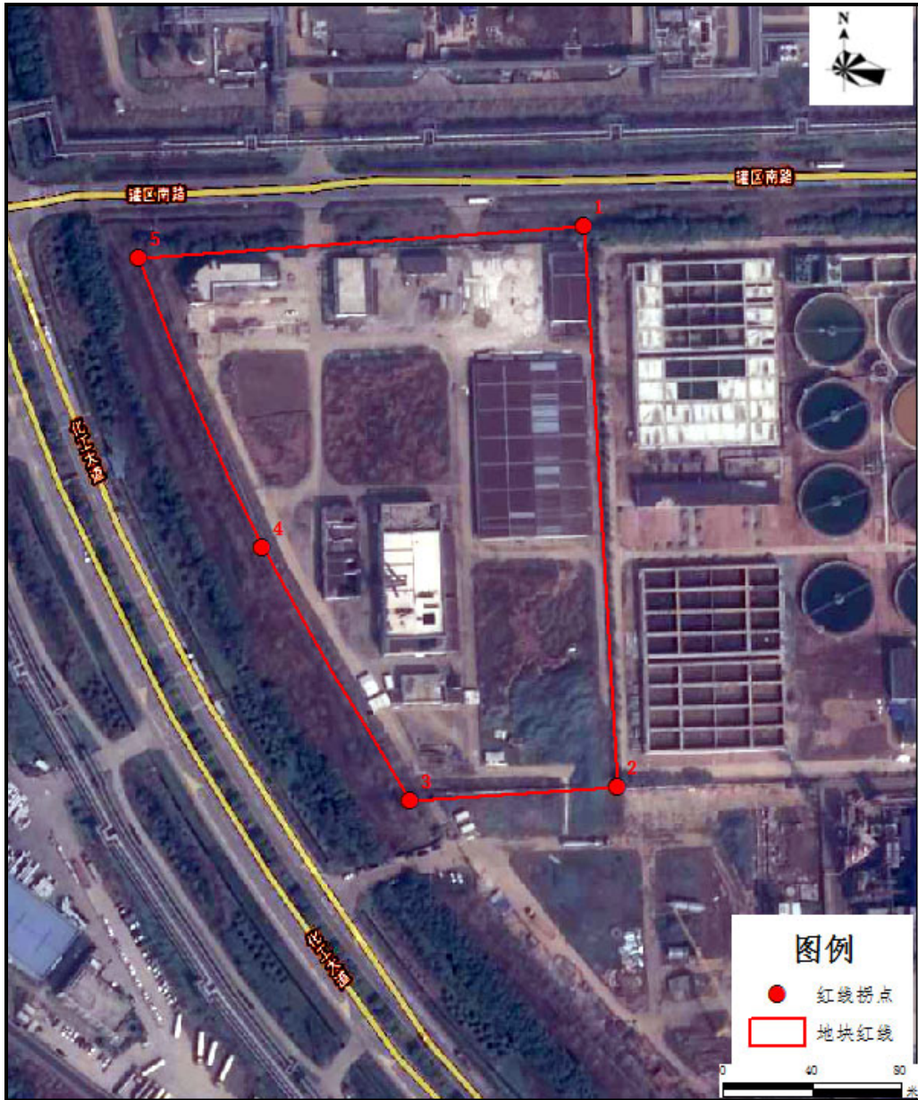
图 1.1-2 调查范围拐点示意图