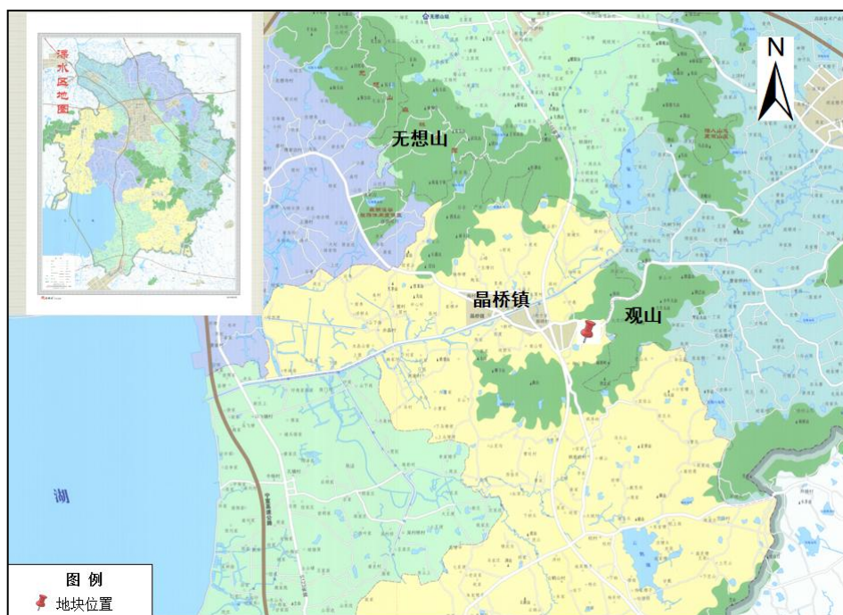
图 1 本次调查评估地块地理位置

本次风险评估地块为溧水区晶桥镇白明线以北原观山化工园 A 区（原南京市溧水县观山精细化工有限公司剩余区域）地块，位于南京市溧水区晶桥镇，占地面积 47.4 亩（约 31586m 2 ）；调查地块未来规划仍为工业用地，调查评估范围见图 2。