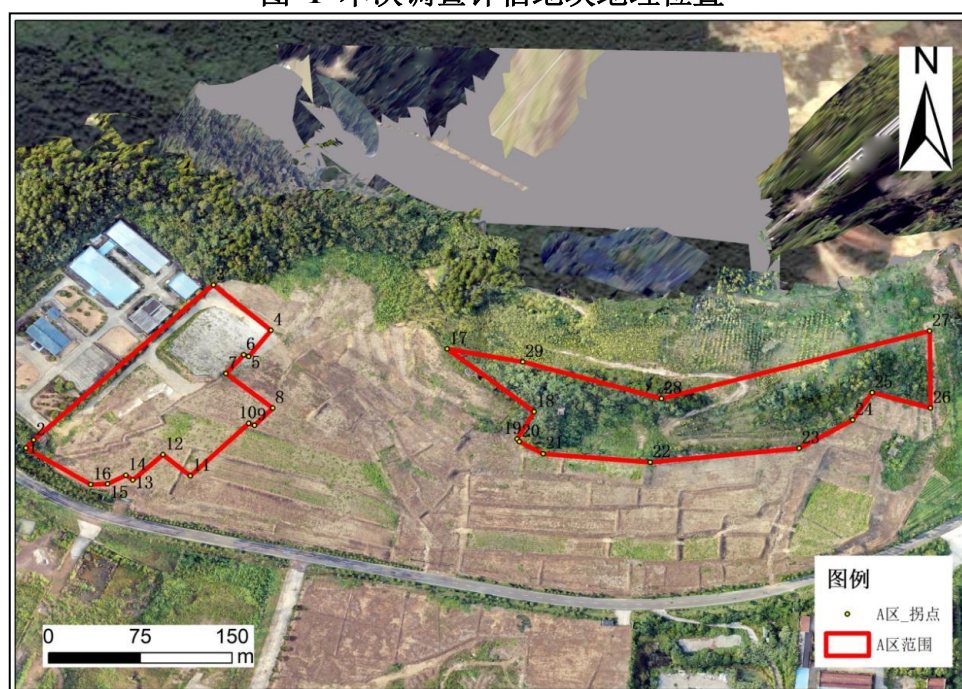
图 2 调查范围示意图（底图为 2021 年 4 月航拍）