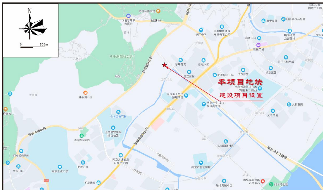
图 1 调查地块地理位置示意图